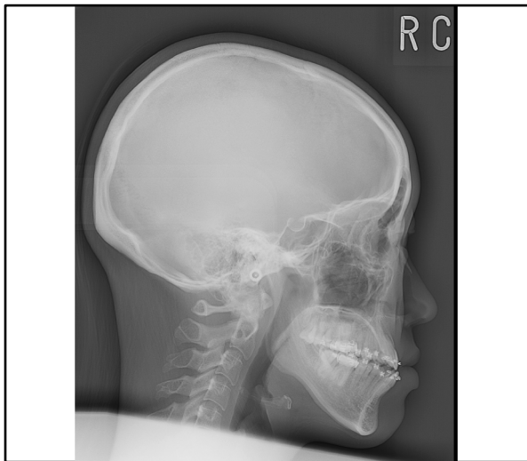
術前側面X線規格写真