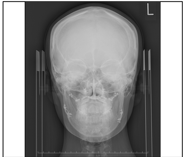
術後正面X線規格写真（術後 1年）