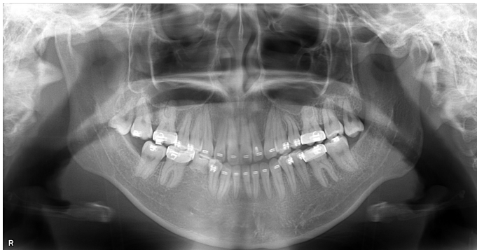
術前パノラマX線写真