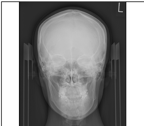
術前正面X線規格写真